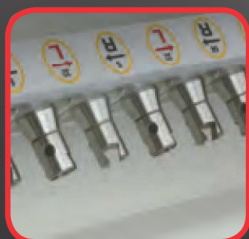
Vřetena s rychloupínáním