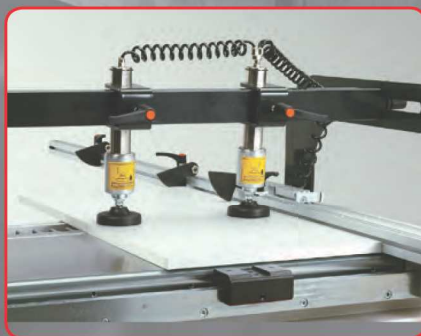
Pravítko pro vrtání řad otvorů