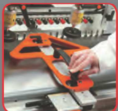
Zarážka pro vrtání s úhlem 45°