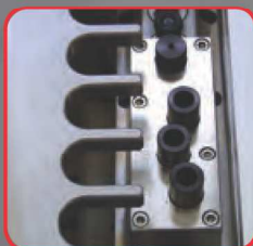
Vrtací hlava pro závěsy dvířek