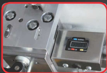
Elektronický ukazatel polohy pravítek