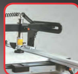
Pravítko 3000 mm se čtyřmi zářkami