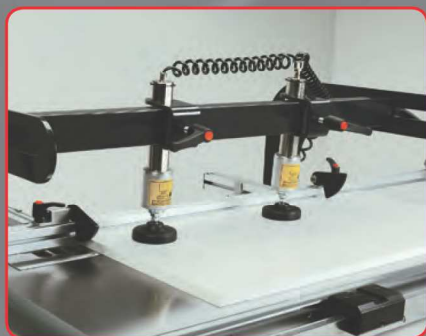
Vertikální přítlaky uloženy pod úhlem 15° pro přesné upnutí dílce k dorazům