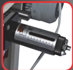
Revolverový doraz pro hloubku vrtání - 6 poloh