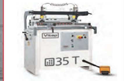
35 vřeten 0-90° max. šířka 1308 mm