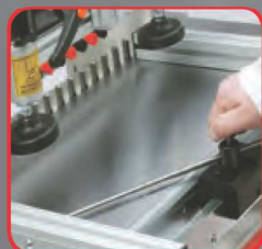
Zařízení pro zajištění symetrie vrtání