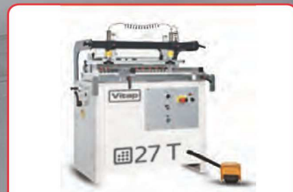
27 vřeten 0-90° max. šířka 992 mm